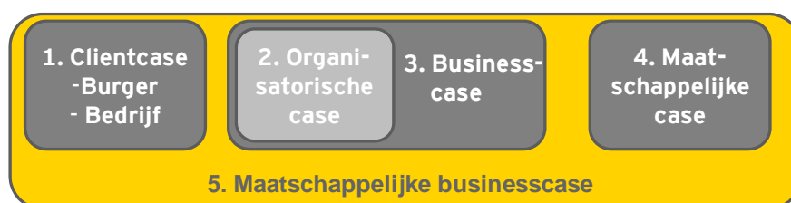
Figuur 1: maatschappelijke businesscase